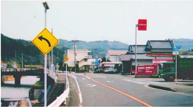
アレッド・サイン202 施工例