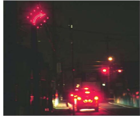
アレッド・サイン202(1.0倍) (夜)