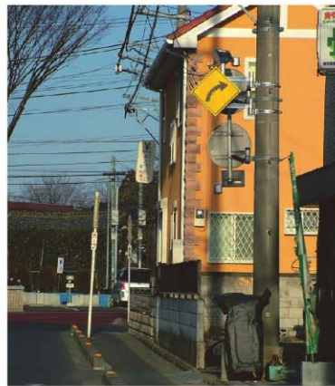
アレッド・サイン202(1.0倍) 特注